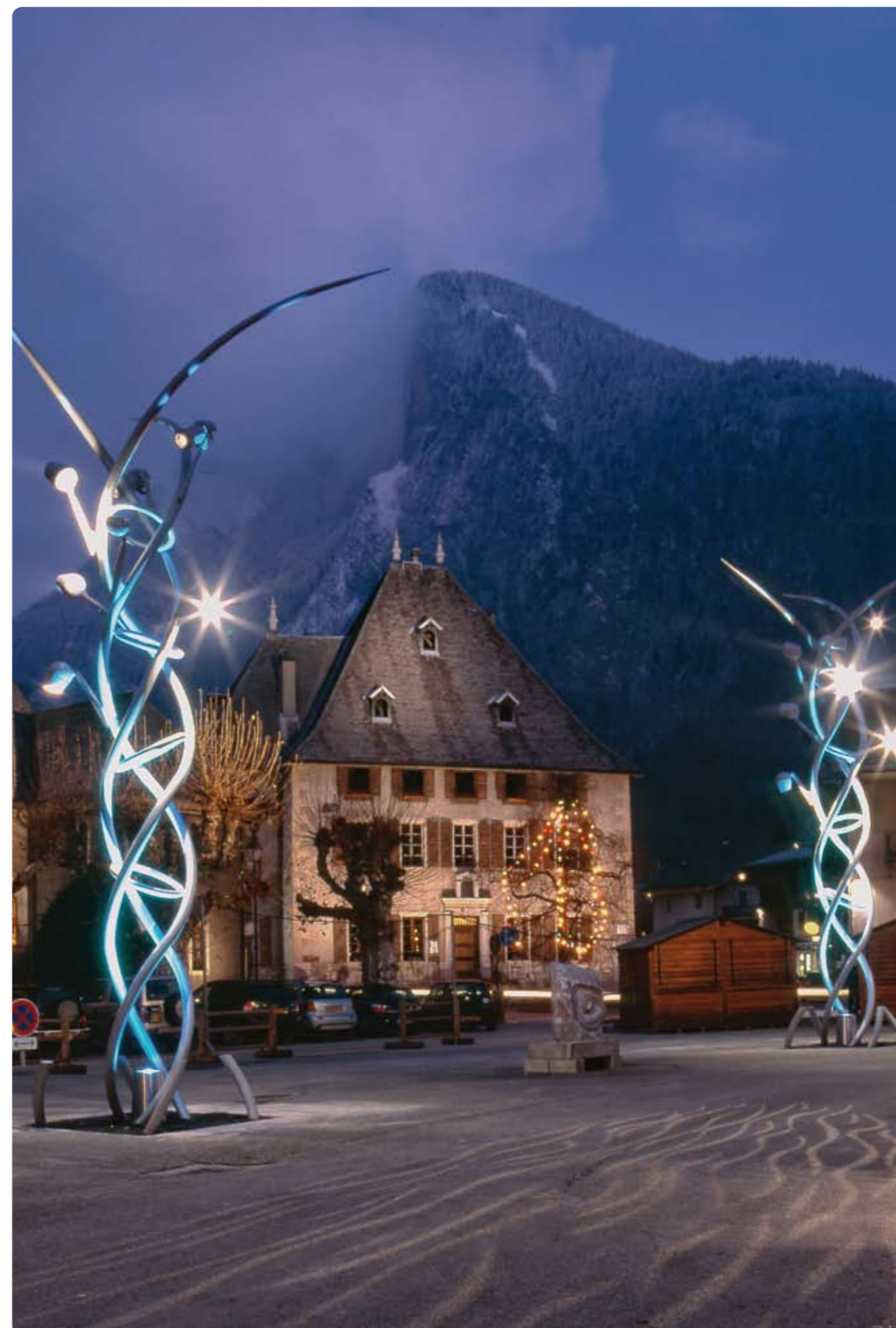
Place du gros tilleul à Samoëns (74) Conception : Agence Cobalt