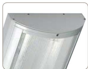
Embout de fermeture