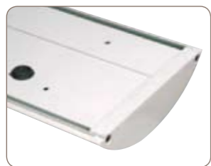
Survivor SX 508 LC

Survivor SX 508 LC : thermolaquage Ral ou Futura, couleur au choix.