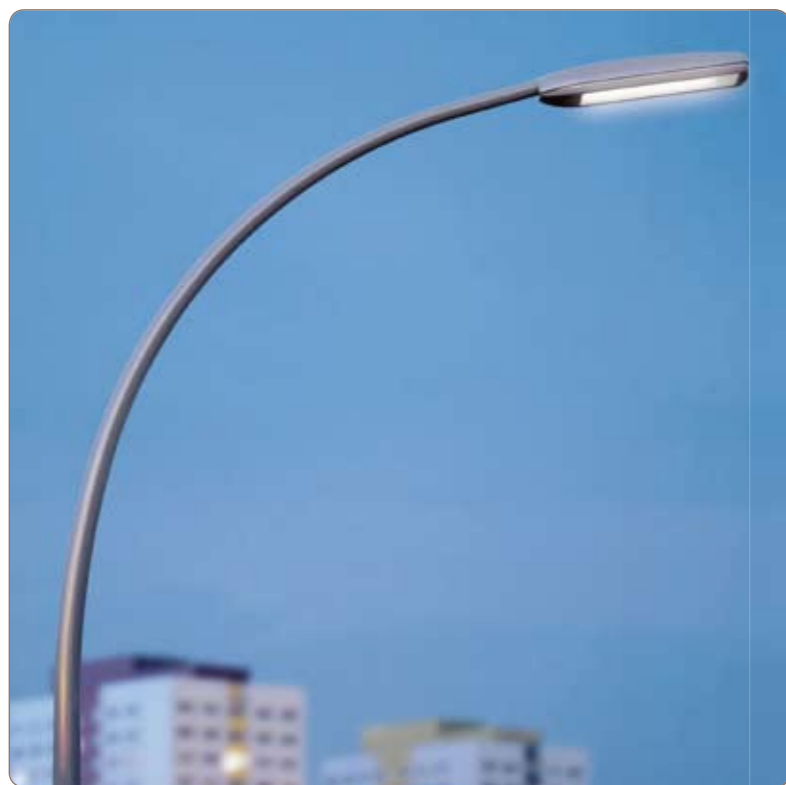
Variante : ensemble courbe, ville de Berlin (Allemagne)

Thermolaquage Ral ou Futura, couleur au choix.