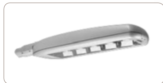
Jessica 600 version LED

Thermolaquage Ral ou Futura, couleur au choix.