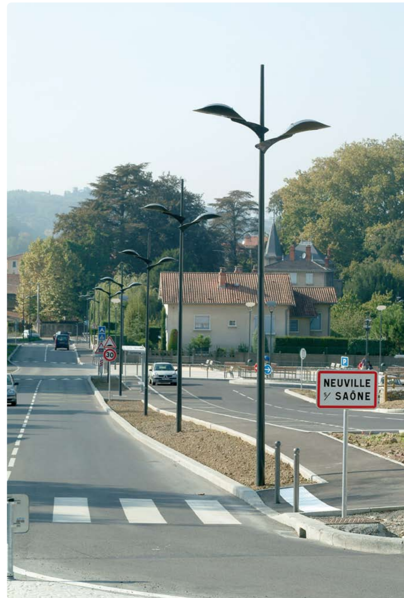
Neuville-sur-Saône (69) Conception : Ville de Neuville-sur-Saône / SIGERLY